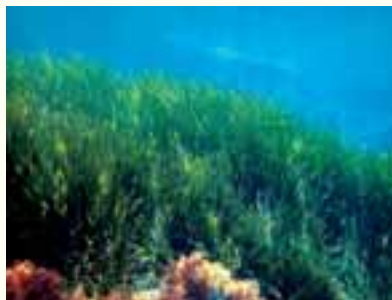
Un posidonieto in buono stato di conservazione

Un ulteriore strumento di pianificazione è costituito dalla cartografia (alla scala 1:10.000) con delimitazione ufficiale dei 26 SIC liguri (D.G.R. 1561, 2005), anche se la protezione del SIC di un habitat prioritario deve essere assicurata indipendentemente dai confini identificati in un determinato tempo. La prateria di posidonia potrebbe aumentare la sua superficie nel tempo e tutta l'area deve essere protetta, non solo quella all'interno dei confini riportati nella cartografia.