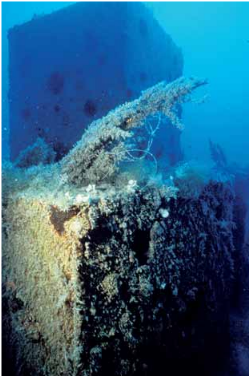
Piramide di una barriera artificiale posta a protezione del posidonieto

alla morte degli stessi. Questa è la principale causa della risalita (spostamento verso la costa) del limite inferiore del posidonieto, come ampiamente documentato in tutto il Mediterraneo nord occidentale. Nel Lazio si è passati da 35 m a 25-30 m. In Liguria la profondità media del limite inferiore è a soli 23 m.