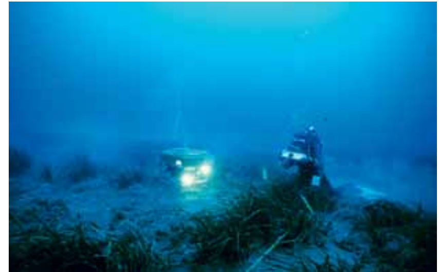
Sorveglianza del posidonieto con sommozzatore scientifico e veicolo filoguidato

La quasi totalità dei dati necessari deve essere raccolta in immersione subacquea autonoma: è dunque indispensabile che ricercatori e tecnici che si occupano della sorveglianza del posidonieto siano anche provetti sommozzatori, con preparazione specifica all'immersione scientifica. I parametri che è necessario misurare possono essere rilevati a tre diversi livelli di complessità ecologica: l'analisi degli ecosistemi comprende infatti lo studio degli individui, delle popolazioni e delle comunità. Nel caso dell'ecosistema a P. oceanica , l'individuo è la pianta, la popolazione è la prateria, la comunità è l'insieme di organismi che vivono associati alla prateria.