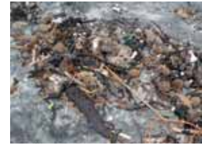
Accumuli di vegetali spiaggiate

I depositi di foglie e rizomi spiaggiate si accumulano sui litorali e in passato erano considerati fonti di ricchezza e venivano utilizzati per imballare ceramiche, terrecotte e vetro, per le lettiere delle stalle e per la pacciatura dei terreni agricoli. I frutti venivano mangiati in alcuni centri costieri dell'Africa del Nord o venivano dati insieme alle foglie come integratori alimentari per gli animali. Le praterie sono formazioni stabili e resistenti ai cambiamenti climatici, ma sono vulnerabili all'aratura della pesca a strascico praticata illegalmente sotto costa; danneggiano inoltre questo habitat le arature delle ancore di natanti. Anche l'inquinamento causato sia dalle acque reflue non depurate sia dalla discarica sul litorale di materiali residuati dalla demolizione di manufatti, di scarti di prodotti industriali, di plastiche residuati dalla copertura delle serre in agricoltura fanno morire le praterie.