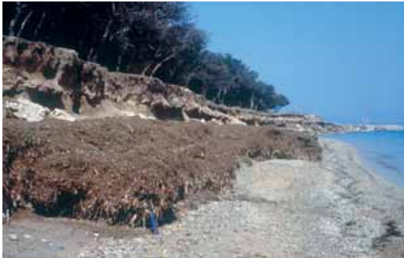
Banchetti di posidonia spiaggiata

Le caratteristiche peculiari di una pianta marina sono: adattamento alla vita in ambiente stabilmente caratterizzato da concentrazioni di salinità comprese tra 35 e 39 ‰ che genera una pressione osmotica superiore a quella del citoplasma; capacità di vivere continuamente sommersa, cioè di assumere per la respirazione e la fotosintesi l'ossigeno e il carbonio dell'acido carbonico disciolti nell'acqua di mare; presenza di un efficace sistema di fissazione al fondo e una opportuna architettura fogliare per resistere alla forza delle onde e delle correnti e per assorbire i nutrienti soprattutto con le foglie; pigmenti ausiliari con funzioni di antenne per captare le basse intensità luminose e utilizzare bande della luce solare con lunghezze d'onda inferiori a quelle del rosso, capaci di fenomeni di risonanza per trasmettere energia sufficiente ad eccitare la molecola della clorofilla e realizzare la fotosintesi; impollinazione idrofila con potere di galleggiamento dei pollini esattamente bilanciato per la lunghezza dei pistilli e la forma degli stimmi dotati di sostanze vischiose non idrosolubili per trattenere i pollini e farli germinare per portare infine i nuclei gametici maschili ad unirsi con i nuclei femminili formati nelle cellule gametiche germinate nell'ovario; capacità dei semi di disperdersi nell'acqua e di