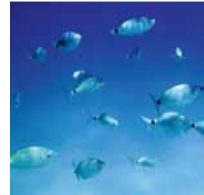
Occhiate ( Oblada melanura )

Data la ricchezza e complessità della comunità associata, le tecniche di studio delle diverse componenti sono altrettanto varie e diversificate. Molte di queste sono estremamente specializzate e vengono adottate solo per studi particolari, non per la sorveglianza di routine dell'ecosistema a P. oceanica . Gli invertebrati vagili dello strato fogliare vengono campionati con un retino da sfalcio, mentre per gli invertebrati vagili associati allo strato dei rizomi e al sedimento superficiale si utilizza una sorbona. L'infauna della "matte" e del sedimento si raccoglie con speciali carotatori adattati per l'uso subacqueo, o con particolari zappe e pale in grado di penetrare e tagliare la "matte". Per tutte queste componenti i tradizionali attrezzi di superficie come benne e draghe sono poco efficienti. Il prelievo diretto di un certo numero di fasci viene usato per la flora e la fauna sessile dei rizomi e per gli organismi perforatori che vivono all'interno delle scaglie e che comprendono alcune specie di policheti e di isopodi.