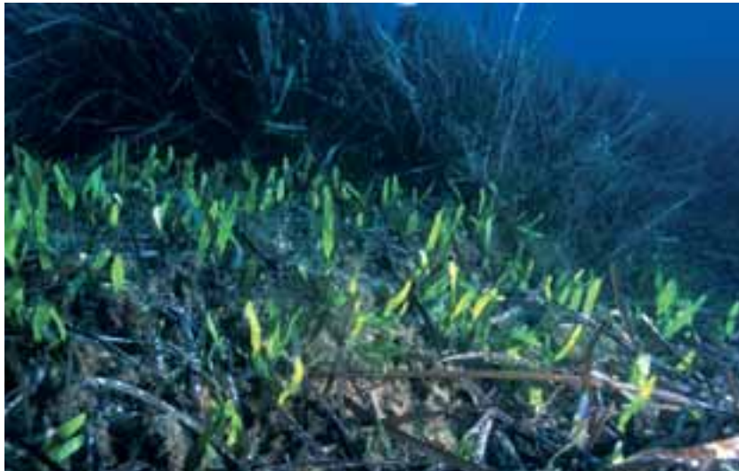
Posidonia oceanica e Caulerpa prolifera

Per quanto riguarda gli habitat riguardanti le fanerogame nell'allegato 2 del protocollo SPA/BIO (specie minacciate o in pericolo), sono elencate tra le Magnoliofite marine: Posidonia oceanica , Zostera marina , Nanozostera noltii (= Zostera noltii e Z. nana ).