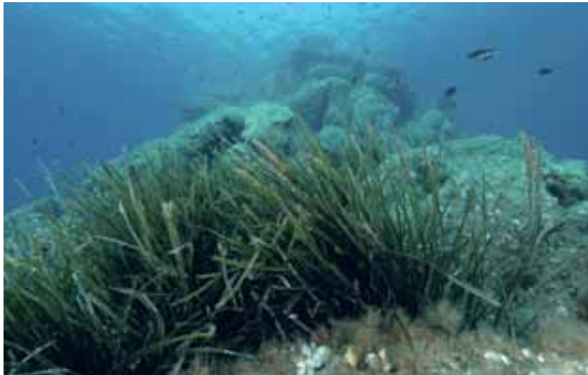
Posidonia oceanica su roccia

● Collaborazioni: si consiglia di coinvolgere nell'attività didattica sulla costa il personale di una Area Marina Protetta, di Associazioni ambientaliste che si occupano del mare, di circoli subacquei aperti all'educazione ambientale e, ove è possibile, anche di studenti e docenti universitari esperti o informati in biologia ed ecologia marine. Le escursioni si consiglia di effettuarle in settembre e ottobre per raccogliere il materiale spiaggiato negli accumuli costieri e anche per fare nuotate con maschere e pinne sulle praterie a bassa profondità; per raccogliere i semi si consiglia di fare le escursioni nelle prime settimane di maggio e giugno.