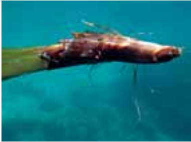
Il rizoma di posidonia

Il crescente diffondersi delle pratiche di maricoltura che utilizzano gabbie galleggianti per l'accrescimento e/o l'ingrasso di pesci lungo le coste del Mediterraneo, è una ulteriore minaccia per la conservazione del posidonieto. Infatti non mancano le documentazioni dei disastrosi effetti sui posidonieti da parte di questo tipo di maricoltura, che dovrebbe essere assolutamente vietata non solo sulle praterie, ma anche nella loro vicinanza,