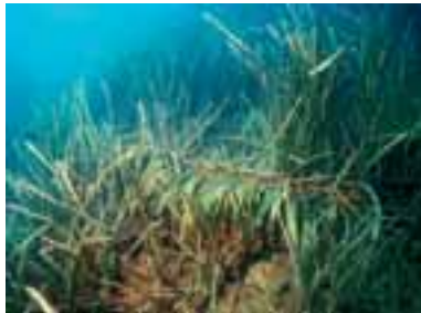
Danni provocati dalla catena di un'ancora