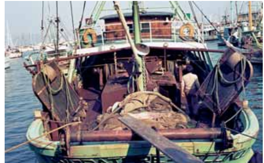
I divergenti dello strascico arano il fondale e distruggono la prateria a fanerogame

La diminuzione dell'illuminazione, dovuta in particolare alla torbidità delle acque, provoca una riduzione della estensione e della densità dei fasci, fino