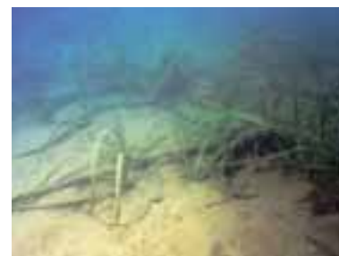
Effetti sul posidonieto di una discarica di sedimenti fini

È ormai assodato, inoltre, che una parte significativa dei danni provocati dalla costruzione di opere marittime è legata al periodo dei lavori e in particolare alle modalità tecniche seguite nel cantiere.