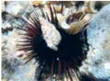
Riccio di mare

strutture in cemento, le tubazioni e i cavi nelle zone a minore profondità e più alto idrodinamismo. Osservazioni condotte sui cavi elettrici e telefonici hanno evidenziato che la semplice posa senza scavo è di gran lunga meno impattante e quindi da consigliare ovunque le condizioni dell'idrodinamismo lo consentano. In alcune situazioni è stato possibile osservare, dopo alcune decine di anni, che i cavi posati sul