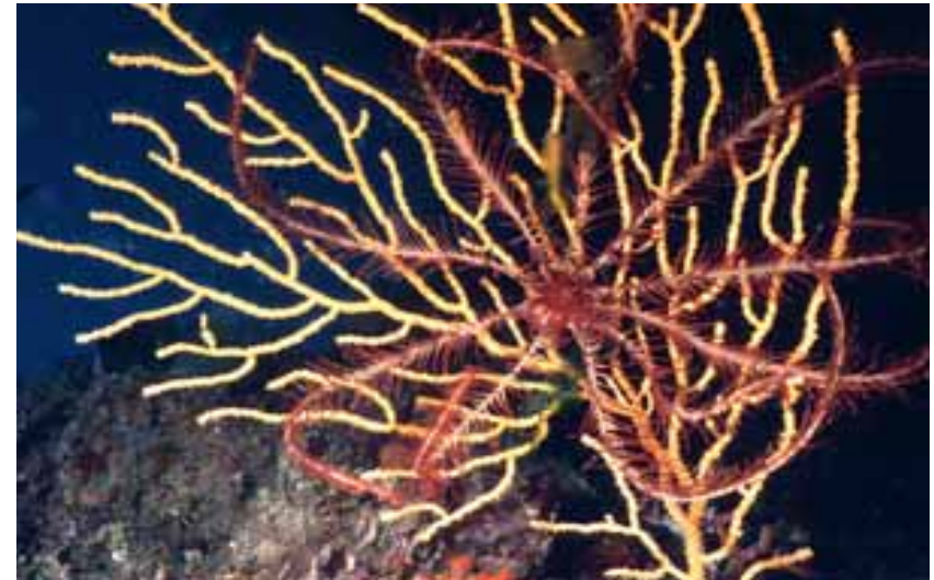
Eunicella cavolini e Antedon mediterranea

I criteri che concorrono a determinare l'inserimento di un'area nella lista ASPIM, sono relativi alla presenza di specie rare, endemiche o minacciate, alla rappresentatività ecologica, al grado di biodiversità, alla naturalità, alle peculiarità dell'habitat, all'importanza scientifica, alla rappresentatività culturale.