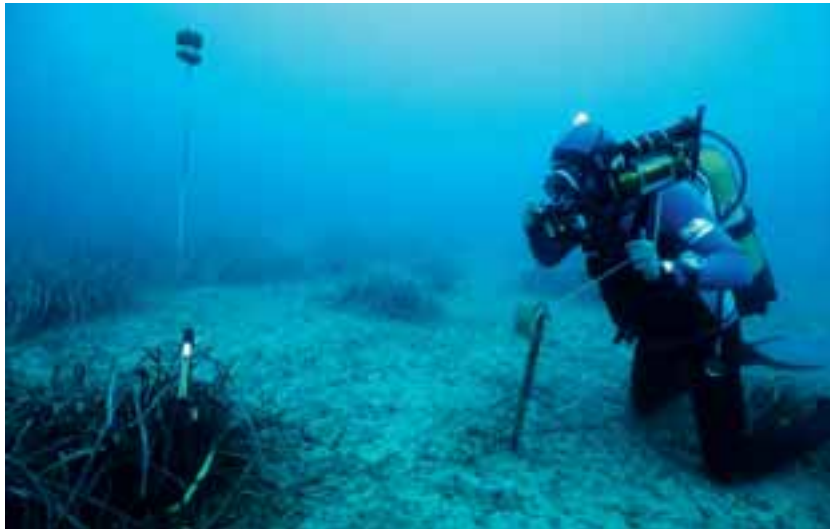
Balisage e rilevamento fotografico del limite inferiore del posidonieto

Al termine del loro periodo vegetativo, i lembi fogliari di P. oceanica si staccano mentre le basi, essendo ricche di lignina e tannini, permangono attaccate al rizoma per moltissimi anni e prendono il nome di "scaglie". In funzione del rango di inserzione lungo il rizoma, lo spessore delle scaglie presenta delle variazioni cicliche secondo il periodo dell'anno in cui le foglie hanno vissuto (massimo in estate-autunno, minimo in inverno-primavera).