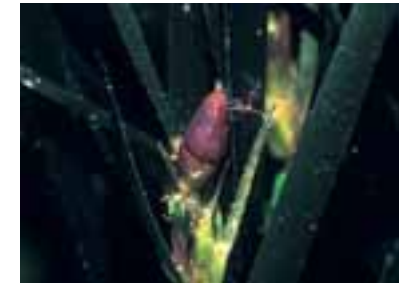
Frutto di posidonia