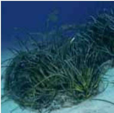
Posidonia presso l'Isola di Molarotto (Sardegna)

pianta colonizza in modo quasi continuo la fascia da -5 m fino a -30 m e in alcuni casi fino a 40 m di profondità. Sono stati censiti oltre 40 siti per una superficie complessiva di circa 27.000 ha. Lo stato ecologico delle praterie attorno a questa regione sembra riflettere il grado di antropizzazione: dove questa è elevata (Sardegna nord-orientale) si osservano praterie con evidenti segni di degrado.