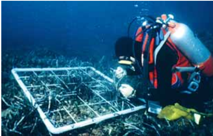
Conteggio dei fasci di Posidonia oceanica

Pari alla proporzione di apici fogliari rotti sul totale delle foglie campionate.