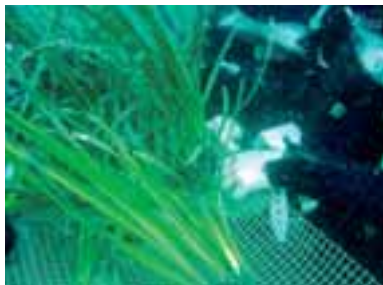
Operazioni di trapianto di posidonia