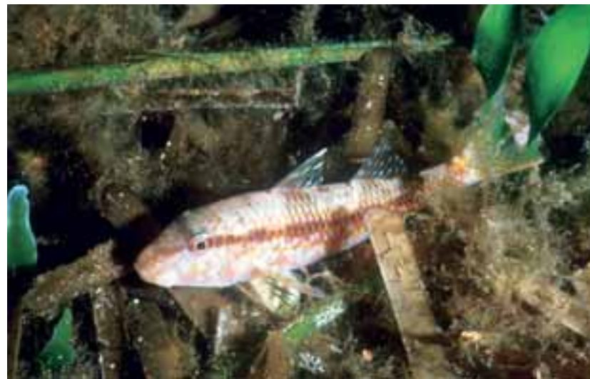
Trigla di scoglio fra residui di foglie di posidonia