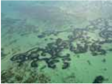
Atolli di Posidonia oceanica

La Direttiva Habitat e SIC. La Direttiva 43/92/CEE del 21/05/1992 relativa alla conservazione degli habitat naturali e seminaturali, nonché della flora e della fauna selvatiche, definisce i concetti di conservazione, gli habitat e le specie prioritari e di interesse comunitario, le zone di conservazione, le aree di collegamento ecologico funzionale, l'introduzione e la reintroduzione. Strategica è la costituzione di una rete di