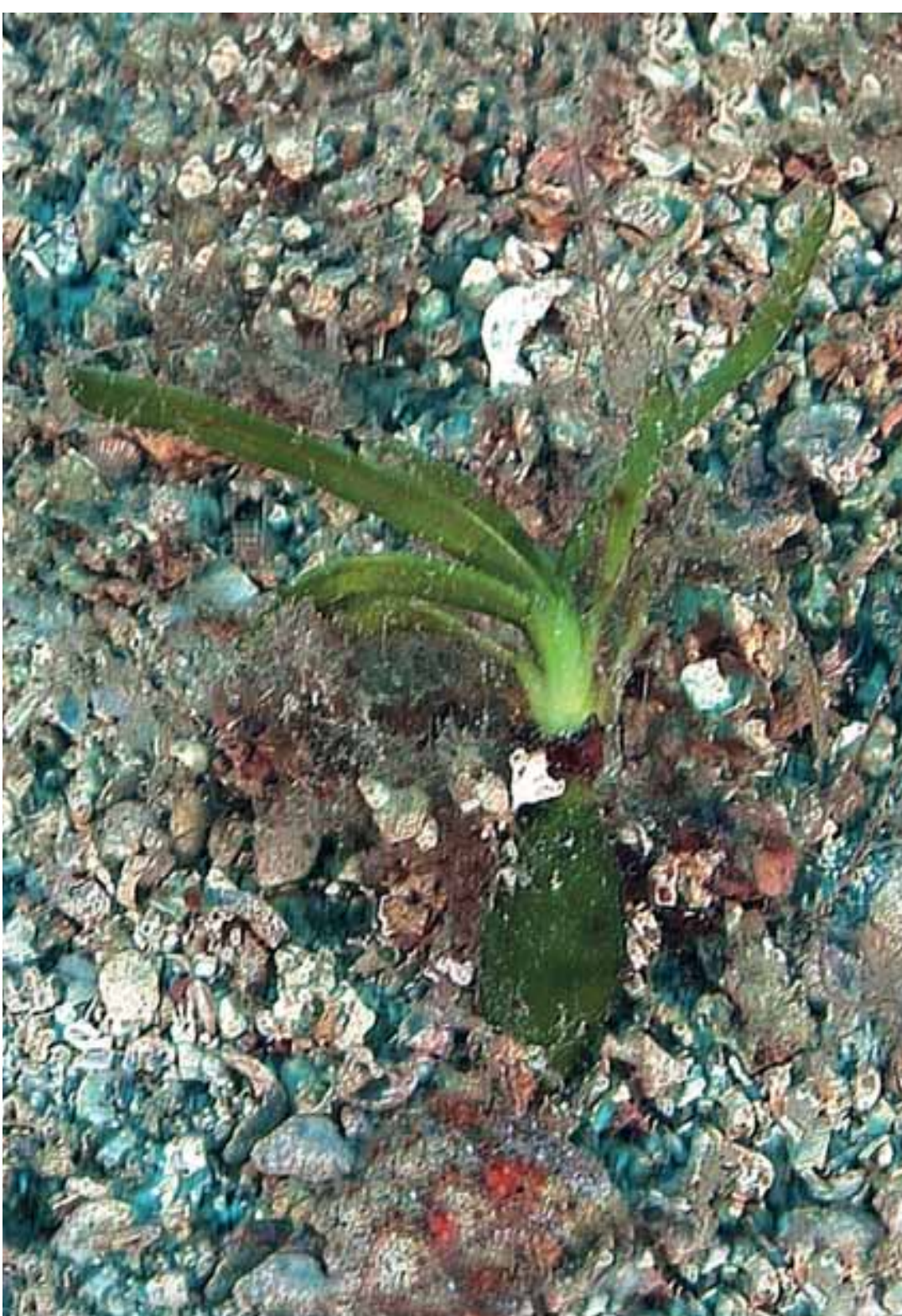
Germoglio di Posidonia oceanica