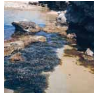
Posidonieto emergente a Pianosa (Toscana)