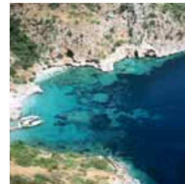
Il posidonieto di Baia degli Infreschi (Campania)

menti idrodinamici sia allo scalzamento dei rizomi di posidonia dovuto anche ad alte intensità di ancoraggi. In diversi siti, sul limite superiore delle praterie, si rinvencono prati di Cymodocea nodosa , mista in rari casi a Nanozostera noltii . Prati a C. nodosa che precedono le praterie di posidonia si rinvencono anche a profondità maggiori, intorno ai 15 m. A Capri P. oceanica si presenta a macchie sparse attorno a tutta l'isola; solamente la parte settentrionale risulta meno colonizzata (da correlare alla particolare