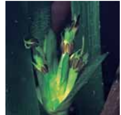
Fiore di posidonia

Un contributo fondamentale a superare le mancanze della Direttiva Habitat in ambiente marino, viene fornito dalla nuova Convenzione di Barcellona (1995) che ha diversi protocolli, tra cui il "Protocollo relativo alle aree specialmente protette e alla diversità biologica in Mediterraneo" (SPA/BIO), il quale non si limita alle acque territoriali, fatto del tutto innovativo. Ogni paese firmatario