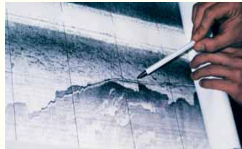
Radure e limite inferiore di un posidonieto come si osservano in un sonogramma

costantemente a disposizione di chi manovra il battello appoggio. Le indagini con il Side Scan Sonar rendono possibile il calcolo delle superfici coperte dalla vegetazione e il monitoraggio dell'evoluzione dei limiti inferiori; anche il dettaglio qualitativo è notevole, infatti, è possibile distinguere dai sonogrammi le praterie di C. nodosa (che presentano trame punteggiate) da quelle di P. oceanica (che presentano trame granulose), oltre che dagli altri tipi di fondale. Tra gli svantaggi legati al metodo in discussione troviamo l'impossibilità, almeno finora, di risalire dai sonogrammi alla densità delle praterie e ad altri dettagli importanti anche se recenti studi hanno testato la possibilità di utilizzare lo strumento per determinare altezza e densità delle praterie. Spesso inoltre si rendono necessarie immersioni di identificazione per il controllo di registrazioni dubbie, particolarmente frequenti in praterie fortemente degradate e in presenza di "matte" morte; l'uso del Side Scan Sonar è inoltre difficoltoso in acque basse (dai 10 metri in su).