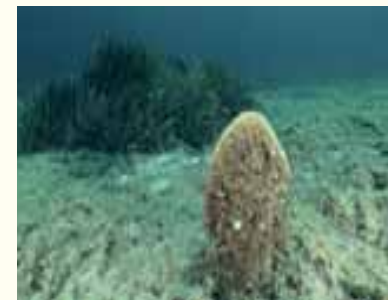
Pinna nobilis e una chiazza di Posidonia oceanica