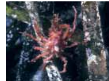
Pisa sp. fra foglie di posidonia

Per approfondire le tematiche illustrate in classe, si consiglia di concordare, con i responsabili di Orti botanici, Musei e Acquari marini, alcune visite guidate per osservare le piante acquatiche delle vasche degli Orti botanici, per vedere fogli di erbario di angiosperme e alghe marine e imparare le tecniche di preparazione, conservazione e schedatura e negli Acquari marini per osservare i vegetali che si coltivano per riprodurre, semplificarli, gli habitat naturali per gli animali.